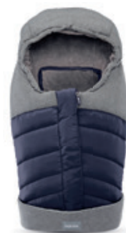
Newborn Winter Muff per culla e seggiolini auto scopri tutte le varianti a pagina 108 Newborn Winter Muff for carrycot and car seats discover the colour range on page 108