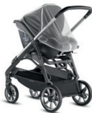
Zanzariera per seggiolino auto Infant Mosquito net for Infant car seat