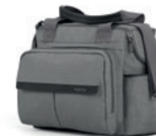
Borse Scopri i modelli e i colori a pagina 100 Bags Discover the colour range on page 100