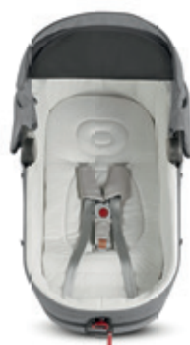
Kit Auto per culla Carrycot Kit Auto