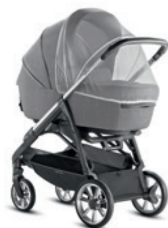
Zanzariera per carrozzina Mosquito net for pram