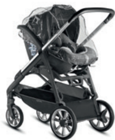
Parapioggia per seggiolino auto Infant Rain cover for Infant car seat