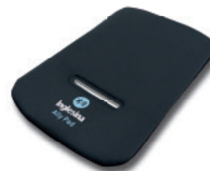
Ally Pad – dispositivo anti abbandono per culle predisposte auto e seggiolini auto Inglesina Ally Pad - car seat baby alert for car-compatible carrycots and car seats by Inglesina