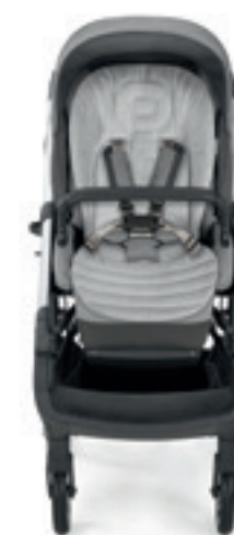
Baby Snug Pad - Cuscino riduttore per passeggino Baby Snug Pad - Stroller adapter