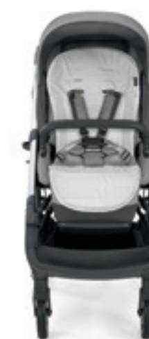
Summercover per passeggino Summercover for stroller