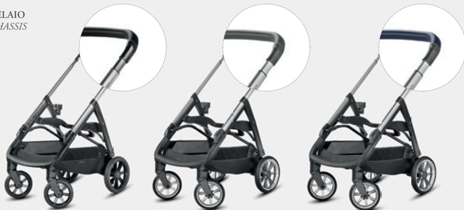
Telaio Nero/Nero Black/Black Chassis