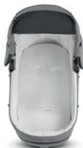
Rivestimento per materassino culla Pram mattress cover