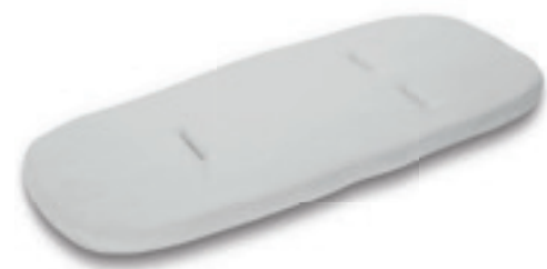
Materassino aggiuntivo culla Carrycot additional mattress