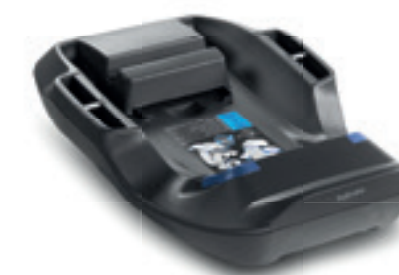
Base per seggiolino auto Cab 0+ (ECE R44/04) Base for Cab 0+ Infant car seat (ECE R44/04)