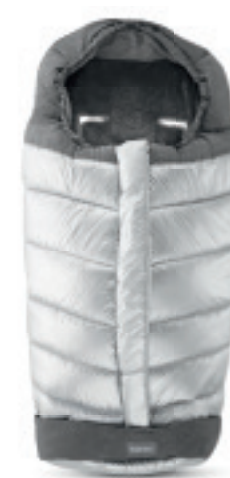
Sacco invernale Passeggino Scopri tutte le varianti a pagina 108 Stroller Winter Muff Discover the colour range on page 108