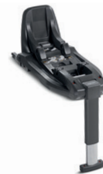
Base Darwin i-Size per seggiolini auto Darwin Infant i-Size e Darwin Toddler i-Size (ECE R129) Darwin i-Size Car Base for Darwin Infant i-Size and Darwin Toddler i-Size car seats (ECE R129)