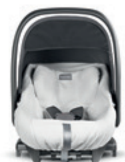
Summercover per seggiolino auto Cab 0+ / Darwin Infant i-Size Summercover for Cab 0+ / Darwin Infant i-Size car seat