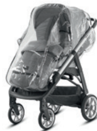
Parapioggia per passeggino Rain Cover for stroller