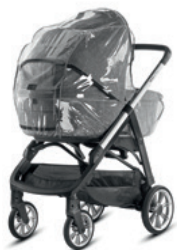
Parapioggia per carrozzina Rain Cover for carrycot